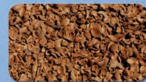
Gusci di mandorle, nocciole e pinoli - Almond, hazelnut and pine shells