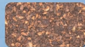
Sansa di olive Olive Husks